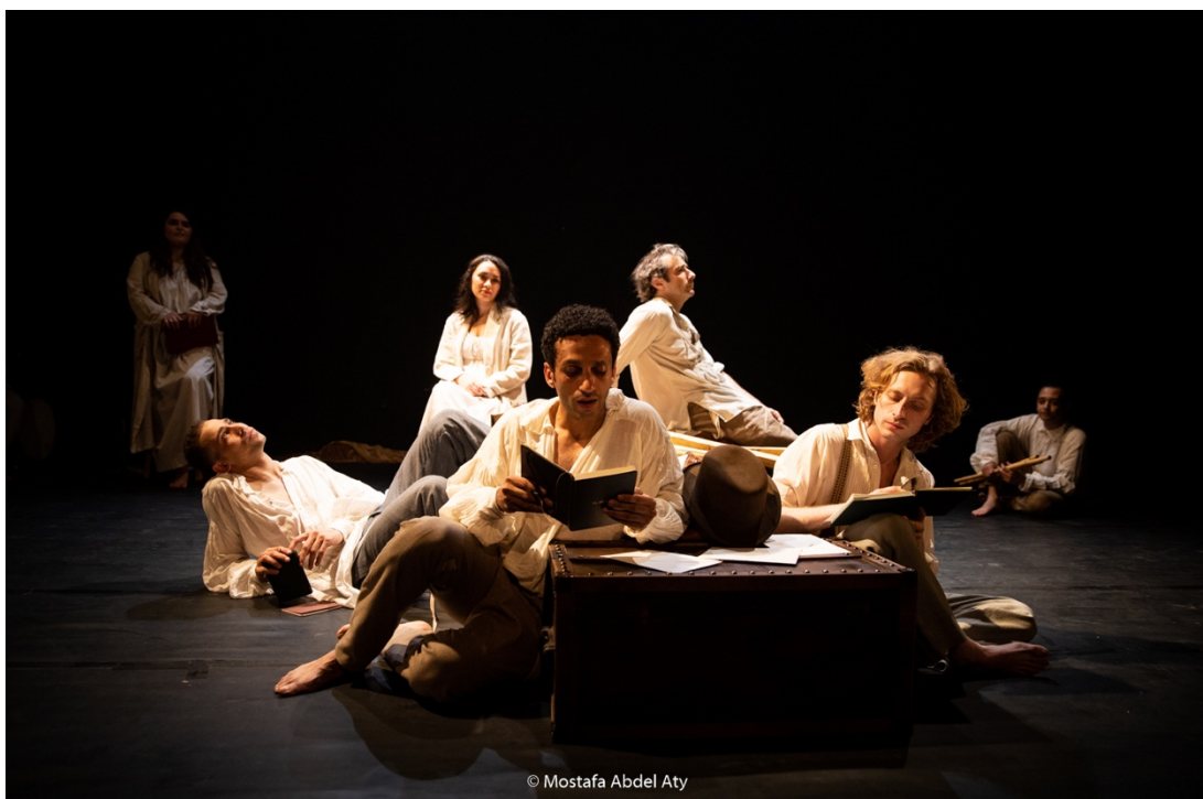
Représentation au Théâtre de Rawabet au Caire (Égypte)