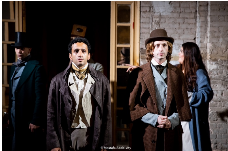
Représentation au Théâtre de Rawabet au Caire (Egypte)

Avec les soutiens de la Région Normandie, l'Institut Français de Paris, l'Institut Français d'Égypte, Le Département de l'Eure, Châteauvallon Scène Nationale.