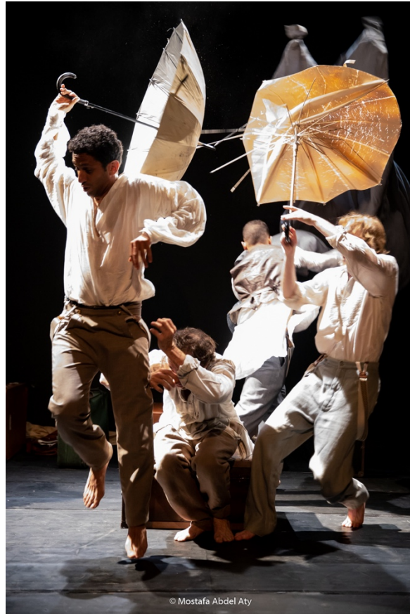
Représentation au Théâtre de Rawabet au Caire – juin 2022